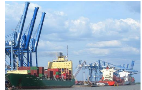
Việt Nam sẽ tăng gấp 10 lần kim ngạch xuất khẩu trong 35 năm tới.

như Trung Quốc, Mỹ, Đức, Hàn Quốc, Ấn Độ, Mexico, Pháp, Nhật Bản và Singapore.