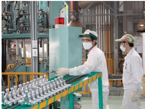
Giải ngân vốn FDI vào các dự án trong 11 tháng qua tăng 17,9% so với cùng kỳ năm ngoái

30% so với cùng kỳ và 692 lượt dự án tăng vốn, tăng 34,4%, với tổng vốn đăng ký mới và tăng thêm ước đạt trên 20,22 tỷ USD, tăng 16,7% (trong khi cùng kỳ giảm 16,7%).