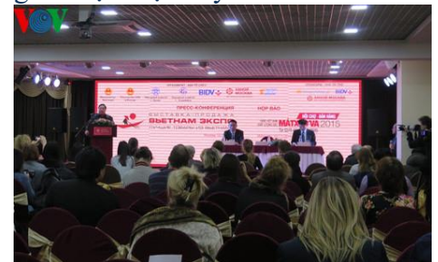
Họp báo giới thiệu Hội chợ - bán hàng "Hàng Việt Nam chất lượng cao Moscow 2015".