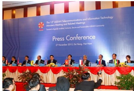
Buổi họp báo thông báo kết quả Hội nghị của các Bộ trưởng.

minh Viễn thông quốc tế giai đoạn 2016-2020. Theo đó, ASEAN và Liên minh cam kết tăng cường hợp tác trong lĩnh vực ICT; khuyến khích, tạo điều kiện thuận lợi, thúc đẩy và thực hiện các hoạt động chung để góp phần hiện thực hóa tầm nhìn của các Bộ trưởng phụ trách viễn thông và CNTT ASEAN