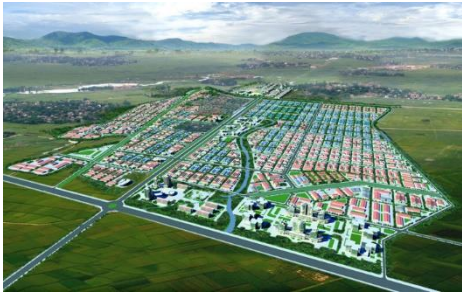
Khu công nghiệp VSIP Quảng Ngãi