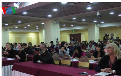
Đông đảo phóng viên Nga tới tham dự cuộc họp báo.

Các phóng viên đã nêu nhiều câu hỏi và được giải đáp, thông tin đầy đủ để hiểu hơn về mục tiêu Hội chợ “Hàng Việt Nam chất lượng cao” cũng như những tiềm năng, triển vọng quan hệ hợp tác, đối tác về kinh tế, thương mại giữa các doanh nghiệp Nga và Việt Nam trong thời gian tới.