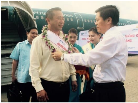
Đại diện Cảng hàng không quốc tế Việt Nam tặng hoa cho hành khách thứ 6 triệu thông qua Cảng.