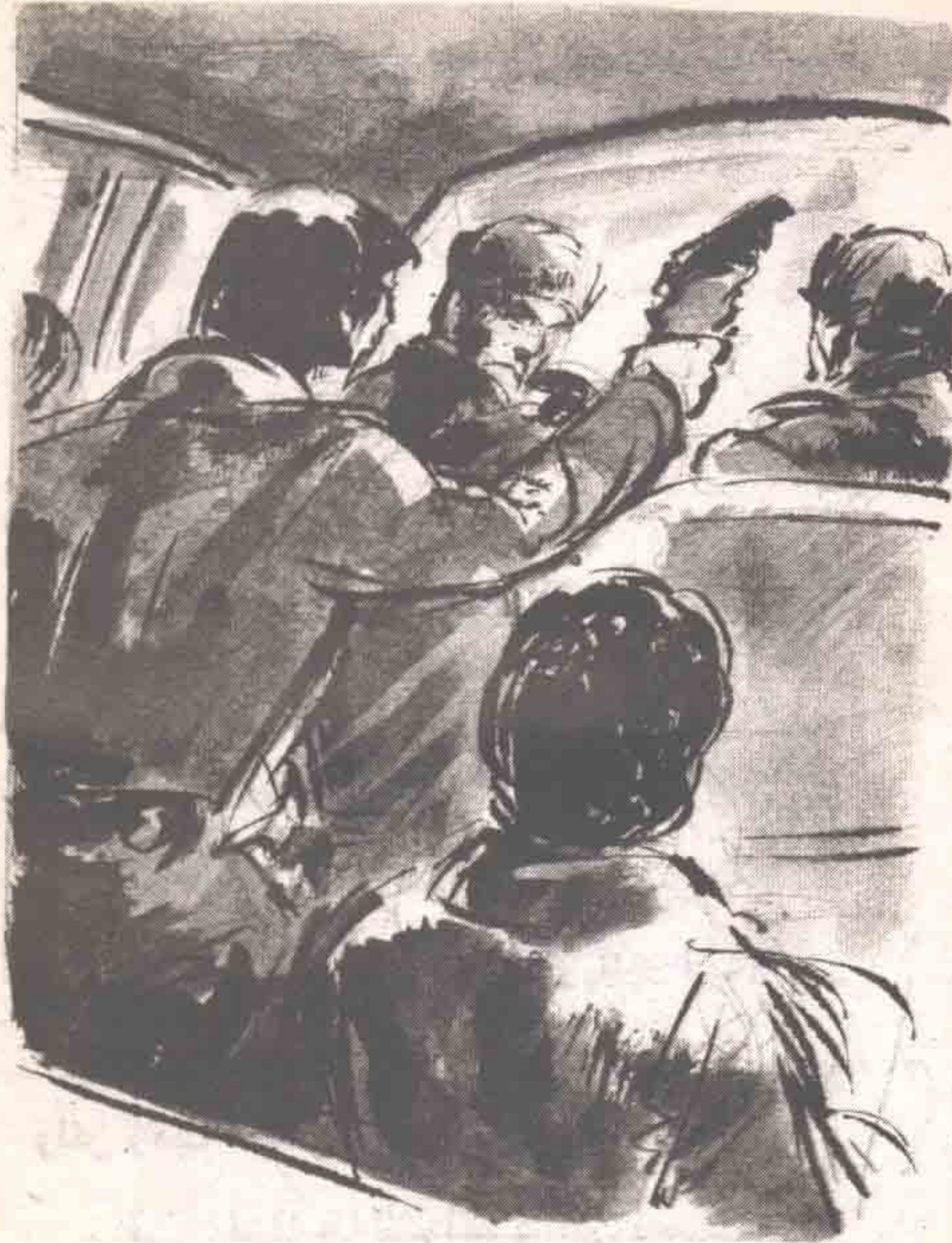
اندفعت يد ( علاء ) تقبض على معصمه ، بأصابع من فولاذ ، وهو يجيب فى صرامة شديدة ..

عاد ينطلق بالسيارة ، فى عصبية واضحة ، جعلت (شريف) يغمغم بالعربية :