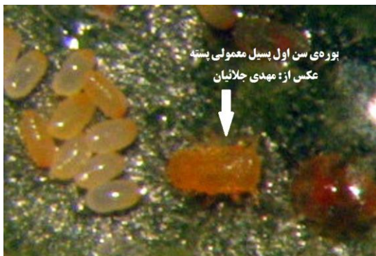
شکل ۲- پوره‌ی سن اول پسیل معمولی پسته که تازه از تخم خارج شده است (اصلی).

ب) مرحله‌ی پوره (نوزاد): نوزادی که از تخم بیرون می‌آید در اصطلاح "پوره" نام دارد که خود دارای پنج مرحله‌ی رشدی است. به این ترتیب که نوزاد خارج شده از تخم را "پوره‌ی سن اول" می‌نامند که کاملاً زردرنگ است (شکل ۲). بعد از مدتی پوره‌ی سن اول پوست‌اندازی کرده و نوزاد بزرگ‌تری به نام "پوره‌ی سن دوم" به وجود می‌آید که کمی بزرگ‌تر است و تحرک بیشتری دارد. این روند ادامه دارد تا در نهایت پس از چهارمین پوست‌اندازی "پوره‌ی سن پنجم" ایجاد می‌شود که دارای لکه‌های قهوه‌ای یا سیاه‌رنگ روی بدن است و در کل تیره به نظر می‌رسد و تقریباً به طول ۰/۹ میلی‌متر و عرض ۰/۴ میلی‌متر می‌باشد (شکل ۳). تمام سنین مختلف پورگی بدون بال بوده و لذا قادر به پرواز نمی‌باشند. پوره‌ها پس از خروج از تخم بلافاصله شروع به تغذیه می‌کنند و از همان زمان هم عسلک ترشح می‌کنند. پوره‌های سنین اولیه تحرک زیادی ندارند.