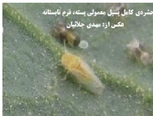
شکل ۴- حشره‌ی کامل پسیل معمولی پسته:

سمت راست فرم تابستانه (اصلی)، سمت چپ فرم زمستانه (مهرنژاد، ۱۳۸۱ الف).