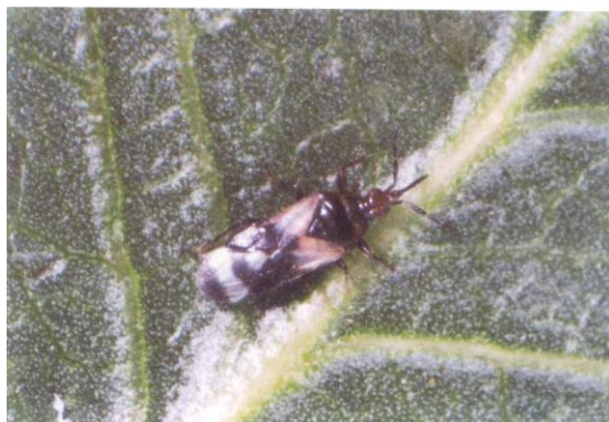
شکل ۱۳- سن شکاری ( Anthocoris sp.) در حال فعالیت روی برگ‌های پسته (مهرنژاد، ۱۳۸۱ الف).