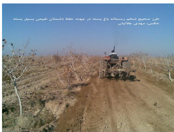
شکل ۶- طرز صحیح شخم زمستانه‌ی باغ پسته در جهت حفظ دشمنان طبیعی پسیل معمولی پسته (اصلی).

ج) شخم زمستانه: مهم‌ترین عملیاتی که در زمستان علیه پسیل در باغ‌های پسته بایستی انجام پذیرد، شخم زمستانه‌ی صحیح است. به این دلیل که مهم‌ترین مکان زمستان‌گذرانی پسیل‌ها در خاک و زیر بقایای گیاهی است بنابراین شخم زمستانه می‌تواند نقش مهمی در کاهش جمعیت آفت داشته باشد. اما از طرفی دشمنان طبیعی آفت (بخصوص زنبور پسیلافاگوس) هم در همین مکان‌ها (بخصوص محل تجمع