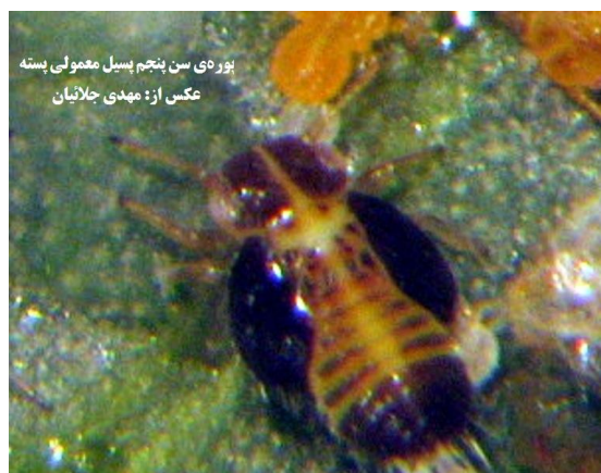
شکل ۳- پوره‌ی سن پنجم پسیل معمولی پسته که دارای لکه‌های سیاه‌رنگ است (اصلی).

ج) مرحله‌ی حشره‌ی کامل: پوره‌های سن پنجم پس از آخرین پوست‌اندازی تبدیل به حشرات کاملی می‌شوند که از نظر جنسیتی برخی ماده و برخی نر هستند. حشره‌ی کامل پسیل معمولی پسته از نظر ظاهری به دو فرم زمستانه (بزرگ‌تر و تیره‌تر) و تابستانه (کوچک‌تر و روشن‌تر) دیده می‌شود. فرم زمستانه به طول ۱/۹ تا ۲/۱ میلی‌متر و به رنگ خاکستری یا قهوه‌ای است و تقریباً از مهرماه به تدریج در میان حشرات کامل در باغ‌ها ظاهر می‌شود. فرم تابستانه به طول ۱/۵ تا ۱/۷ میلی‌متر و به رنگ کرم یا نارنجی کم رنگ است. فرم تابستانه از اواسط اردیبهشت ماه در باغ‌ها ظاهر شده و تا مهرماه دیده می‌شود (شکل ۴).