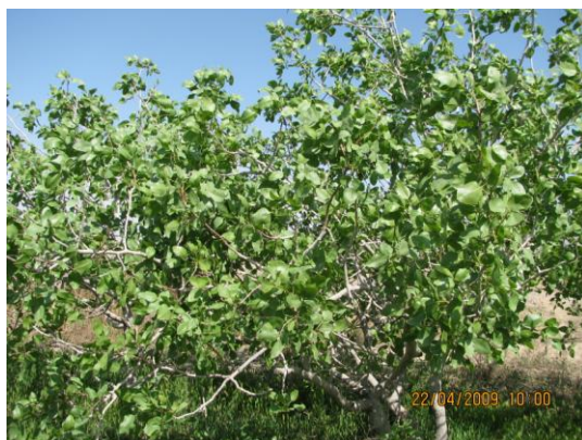
شکل ۸- درخت پسته که در اثر خسارت پسیل در سال قبل، در سال جاری به کلی فاقد میوه است (اصلی).

علامت ذکر شده توجه شود. به عنوان مثال در بهار (اواسط فروردین تا اواسط اردیبهشت) سال ۱۳۹۰ در بیشتر مناطق پسته‌کاری استان درجه‌ی حرارت بسیار بالا بود (بر اساس آمار موجود هواشناسی، در ۱۰ سال گذشته بی‌سابقه بود) به طوری که باعث شد چرخه‌ی زندگی آفت جلو افتاده و همچنین طول دوره‌ی زندگی آفت کوتاه‌تر شود و بنابراین نسل‌های اول و دوم پسیل در اردیبهشت‌ماه ظاهر شده و جمعیت بالایی را روی درختان ایجاد نمودند. بنابراین در این سال برخلاف توصیه‌ی معمول، باغ‌داران مجبور شدند اولین سمپاشی را در اردیبهشت‌ماه انجام دهند.