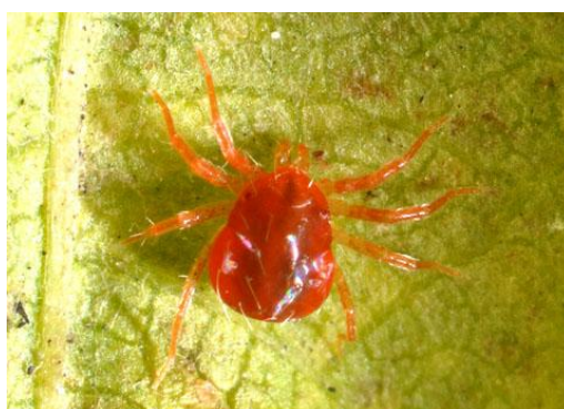
شکل ۱۲- کنه‌ی قرمز آنیستیده در حال فعالیت روی برگ‌های پسته (اصلی).

این کنه‌ی شکارگر در باغ‌های پسته‌ی خراسان رضوی دارای جمعیت بالایی بوده و به راحتی در کلنی پوره‌های پسیل روی برگ‌های پسته قابل مشاهده است. از نکات قابل توجه در مورد این کنه این است که در تمام طول فصل (حتی در ماه‌های گرم تیر و مرداد) فعال بوده و جمعیت بالایی دارد (جلالیان، ۱۳۸۸ و همکاران، ۱۳۹۰).