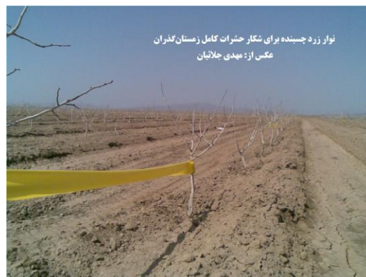
شکل ۷- استفاده از کارت یا نوار زرد چسبنده برای شکار حشرات کامل زمستان‌گذران پسیل معمولی پسته (اصلی).

۳- مبارزه‌ی شیمیایی: در انجام مبارزه‌ی شیمیایی علیه پسیل معمولی پسته به دو عامل اساسی بایستی توجه شود: الف) مراحل رشدی گیاه پسته: زمان مبارزه با پسیل معمولی پسته باید از دیدگاه روابط متقابل آفت (پسیل) و میزبان (گیاه پسته) تعیین گردد. یعنی لازم است زمان‌هایی که گیاه پسته به پسیل حساس می‌باشد یا به بیان دیگر گیاه پسته قادر نیست خسارت آفت را تحمل کند مشخص شود. حساسیت گیاه پسته در طول دوره‌ی رشد و در طول یک فصل رویشی متغیر است. در گیاه پسته مرحله‌ای که میوه‌ها شروع به مغز بستن می‌کنند در حقیقت آغاز مرحله‌ی حساسیت گیاه به تغذیه‌ی پسیل است و بنابراین تا قبل از آن گیاه پسته دارای یک تحمل نسبی نسبت به تغذیه‌ی پسیل می‌باشد. ب) کم خطر بودن روی دشمنان طبیعی بخصوص زنبور مفید پسیلافاگوس. با توجه به دو نکته‌ی فوق مبارزه‌ی شیمیایی علیه پسیل پسته را به چند مرحله‌ی زمانی می‌توان تقسیم نمود (مهرنژاد، ۱۳۸۱ الف) (جدول ۱):