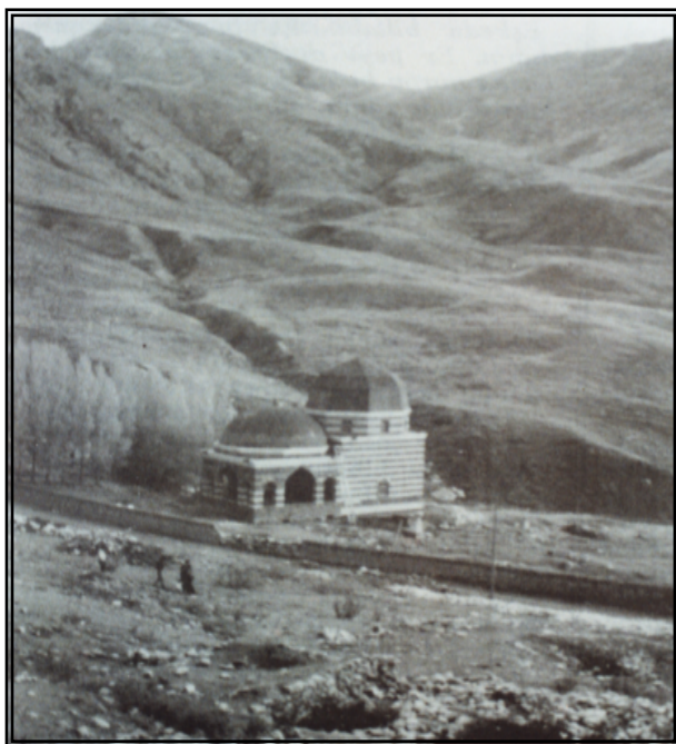
ئەو گونبەدا ژ نوی ل سەر گۆرا خانی هاتیە ئافاکرن

ول دویف حسیبا ئەبجەدی یا فئ عیبارەتی ( ۳۱ ) سالیّن دی ل سەر دیروکا مرنا خانی زیّدە دبن ، و دیروک دبتە ۱۱۵۰ ک ( بەرانبەر ۱۷۳۶-۱۷۳۷ ز ) ، ومەعنا ژیی وی دەمی مری دی ( ۹۱ ) سال بن . وەسا دیارە کو مرنا خانی هەر ل بایەزیدی بوویه ، و گۆرا وی نوکە ل ویری ئاشکەرایە ل نیزیکی شوینوارین مزگەفتا وی ب خو .