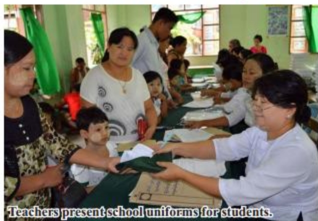
Teachers present school uniforms for students.