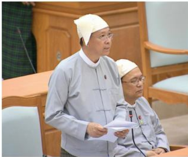
ပြည်ထောင်စုဝန်ကြီး ဒေါက်တာမျိုးသိမ်းကြီး ရှင်းလင်းတင်ပြစဉ်။

ဒုတိယအကြိမ် ပြည်ထောင်စုလွှတ်တော် အငွေပံ့ပိုးမှုအစည်းအဝေးကျင်းပ