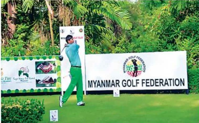
၂၀၁၈ခုနှစ် မြန်မာပြည်တွင်းပတ်လည်ဂေါက်သီးရိုက်ပြိုင်ပွဲ ပထမပွဲစဉ်ဒုတိယနေ့ ယှဉ်ပြိုင်ပွဲများကို တွေ့ရစဉ်။

Yoma Eco Resort(Myanmar)မှ အဓိက ကူညီပံ့ပိုးသည့် ၂၀၁၈ခုနှစ်၊ မြန်မာပြည်တွင်း ပတ်လည်ဂေါက်သီးရိုက်ပြိုင်ပွဲ ပထမပွဲစဉ် ဒုတိယနေ့ယှဉ်ပြိုင်ပွဲများကို ယနေ့နံနက်ပိုင်း