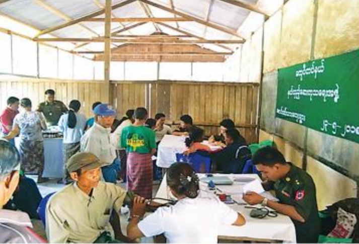
အနောက်မြောက်တိုင်းစစ်ဌာနချုပ် နယ်လှည့်ဆေးကုသရေးအဖွဲ့က ဒေသခံပြည်သူ များအား ကျန်းမာရေးစောင့်ရှောက်မှုလုပ်ငန်းများ ဆောင်ရွက်ပေးစဉ်။

နေပြည်တော် မေ ၂၄ ချင်းပြည်နယ်၊ မတူပီမြို့နယ်၊ စောင်းတီး ယားကျေးရွာနှင့် ပတ်ဝန်းကျင်ကျေးရွာများ ရှိ ဒေသခံပြည်သူများကို မေ ၂၃ရက် နံနက် ပိုင်းတွင် အနောက်မြောက်တိုင်းစစ်ဌာန ချုပ် နယ်လှည့်ဆေးကုသရေးအဖွဲ့က အဆိုပါကျေးရွာရှိ အခြေခံပညာမူလတန်း ကျောင်း၌ ကျန်းမာရေးစောင့်ရှောက်မှု လုပ်ငန်းများ ဆောင်ရွက်ပေးသည်။ ထိုသို့ဆောင်ရွက်ပေးရာတွင် မျက်စိ ရောဂါ၊ ကလေးရောဂါ၊ အစာအိမ်ရောဂါ၊ အသက်ရှူလမ်းကြောင်းဆိုင်ရာ ရောဂါ၊ အထွေထွေရောဂါတို့နှင့်ပတ်သက်၍ ဒေသခံ ပြည်သူ ၁၃၃ဦးတို့ကို လိုအပ်သည့်ဆေးဝါး ကုသမှုများ ဆောင်ရွက်ပေးသည်။ ထို့ပြင် မတူပီတပ်နယ်မှ တပ်မတော်သားများက စောင်းတီးယားကျေးရွာရှိ အခြေခံပညာ မူလတန်းကျောင်း စာသင်ခန်းများ အတွင်း၊ အပြင် သန့်ရှင်းရေးပြုလုပ်ပေးခြင်း၊ ချုံနွယ် ပေါင်းမြက်များနှင့် အမှိုက်များရှင်းလင်းခြင်း တို့ ဆောင်ရွက်ပေးပြီး ကျေးရွာစာကြည့် တိုက်အတွက် သုတ၊ရသ စာအုပ်၊စာစောင် များနှင့် ဒေသခံပြည်သူများအတွက် စား သောက်ဖွယ်ရာများ ပေးအပ်သည်။ ထို့နောက် မြို့နယ်စိုက်ပျိုးရေးဦးစီးဌာန မှ တာဝန်ရှိသူတစ်ဦးက ဒေသခံပြည်သူ များကို စိုက်ပျိုးရေးနည်းစနစ်များ ဟော ပြောဆွေးနွေးခဲ့ကြောင်း သတင်းရရှိသည်။