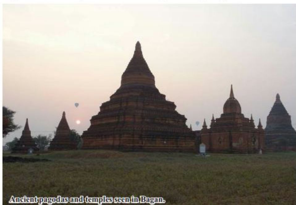
Ancient pagodas and temples seen in Bagan.

map on earthquake danger in Bagan region will expose resilience and possible damage of buildings," said the vice chairman.