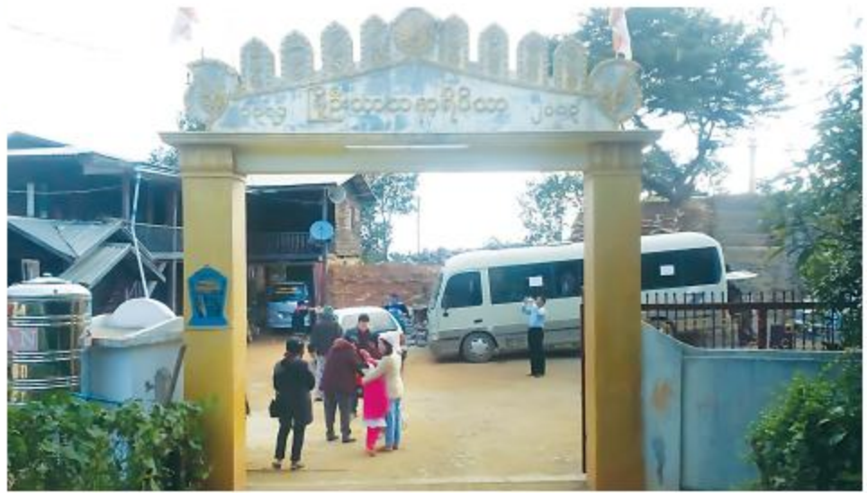
မင်းတပ်မြို့က မြို့ဦးသာသနာရိပ်သာကျောင်းကို တွေ့ရစဉ်။

ဒါပေမဲ့ ကံကောင်းတယ်လို့ပြောရမှာပါ။ ဆိုင်ထဲ က လူတစ်ယောက်ကပဲ ရွှေ့နားလေးမှာ စားသောက်