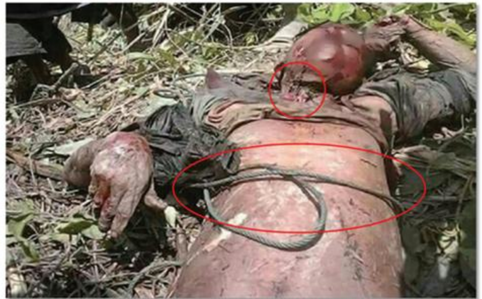
Rakhine Ethnic in Pankaing Village, terribly killed by blood-thirsty Bengali terrorists near Mayu Mountain Ranges

The Myanmar Tatmadaw ordered security forces to strictly abide by the Rule of Engagement-ROE in deploying the least amount of strength to protect security, lives and property of local ethnic people and to carry out self defence of the security forces as ARSA extremist Bengali terrorists and the Bengali terrorists under their organizational arrangements with the estimated strengths between 6,000 and 10,000 committed attacks with the use of small arms, home-made grenades and heavy arms in the incidents of Buthidaung-Maungdaw region of Rakhine State, and exposed the officers and services who offended crimes with personal acts and took action against them. The information about taking action against them was also released in a transparent manner. In meet-