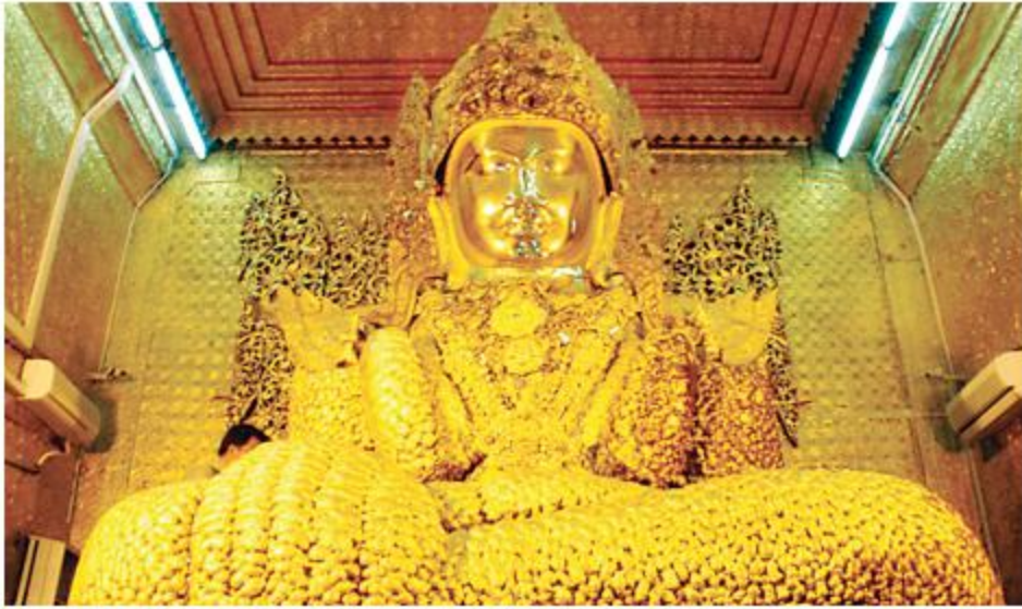
မဟာမုနိရုပ်ရှင်တော်မြတ်အား ဖူးတွေ့ရစဉ်။